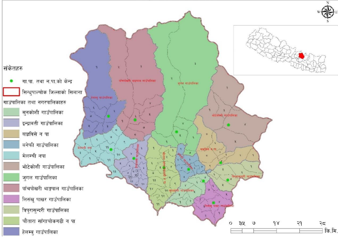
सिन्धुपाल्चोक जिल्लाको नक्शा