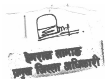
यौवनप्रकाश श्रेष्ठ सभापति